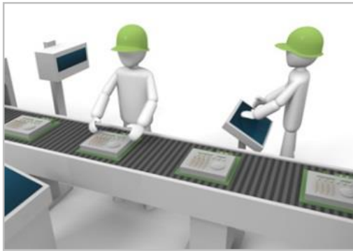
作業に必要な情報が自動的に表示され 業務効率の改善につながります

フォーカスピーコンをスマートグラスと連携させることで、業務効率の改善に欠かせない資料等を自動的に表示できます。また、美術館等ではリッチコンテンツの展開など顧客満足度の向上に直結する新しいサービスの提供が可能になります。