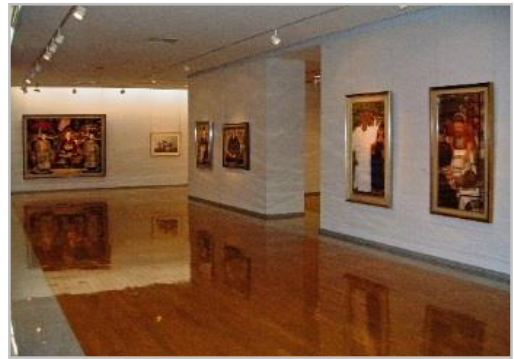
展示物の解説を文字だけでなく 音声や動画を含めたリッチコンテンツとして提供できます