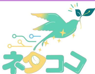
広報部門向けAIアシスタント 「ネタココ」