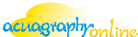
手軽・気軽に・いつも新しいコンテンツセキュリティ 「acuagraphy online」